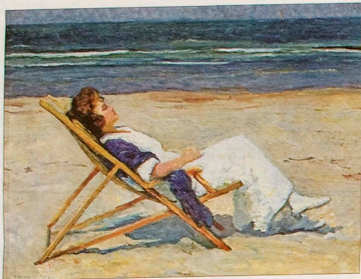
'Strandbeeld' van Maurice Göth (Domburg).