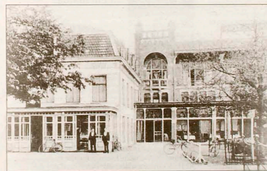
Door de jaren heen was het hotel Hamdorff het trefpunt voor de Nederlandse en buitenlandse kunstenaars die in Laren en omgeving werkten. Max Liebermann werd door Jozef Israëls naar Laren gehaald en logeerde er, Hart Nibbrig was er vaak te vinden en op de latere dansavonden was ook Mondriaan regelmatig van de partij.

den en Ahrenshoop. „We hebben nu gekozen voor deze drie kolonies, omdat ze alle drie op een schiereiland aan de kust liggen en de lichtval, die er min of meer van twee kanten komt, voor heel karakteristieke, vernieuwende impulsen in de kunst heeft gezorgd. In zo'n zestig werken, naast brieven, foto's en kleine werkjes op papier in vitrines, laten we de overeenkomsten én de verschillen in de kunstontwikkeling binnen de drie kolonies zien.“ De tentoonstelling is in mei in Litouwen begonnen en zal eind september van Domburg naar Ahrenshoop reizen, een route waarlangs nog veel andere interessante kolonies liggen. „Maar na de Eerste Wereldoorlog gingen de meeste ten onder, mede doordat het landschapsschilderen toen aan populariteit verloor. Desondanks is de vernieuwende invloed van deze kolonies op de moderne kunst aanzienlijk geweest. Sinds eind jaren tachtig van de vorige eeuw is er een opleving van de Europese kunstenaarskolonies, mede door expositie en publicaties over het fenomeen. In 1994 werd EuroART opgericht in Brussel, onder auspiciën van het Europees Parlement en de Europese Commissie. De vereniging heeft inmiddels tachtig leden in meer dan veertig landen, waaronder Nederland, België, Frankrijk, Duitsland, Denemarken, Engeland, Polen, Rusland en Hongarije. Via expositie en publicaties brengt EuroART het culturele erfgoed van de Europese kunstenaarskolonies