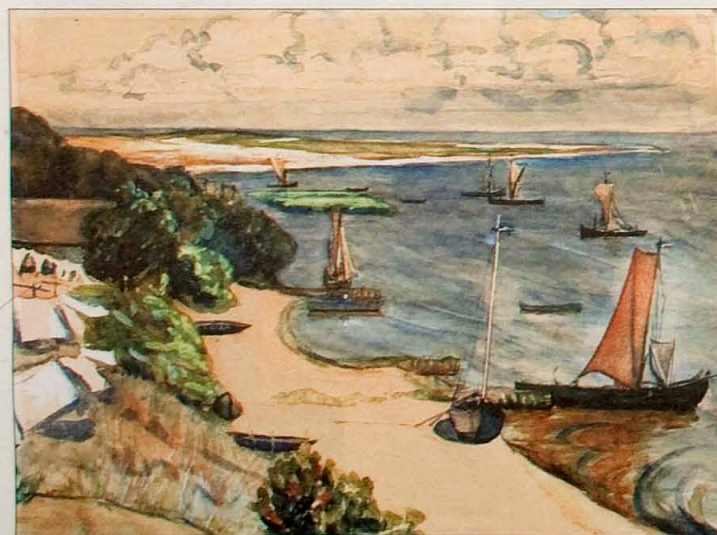
'Purwin mit dem Bullwischen Haken' van Edith Wirth (Nidden).