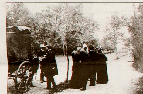
Aankomst van kunstenaars en vrouwelijke leerlingen bij Haus St. Lucas, de schilderschool van Paul Müller-Kaempff in Ahrenshoop, in 1904. Tot 1919 werden vrouwen in principe niet toegelaten tot de officiële academies, zij namen hun toelucht tot kleinere en privé-scholen in de stad of op het land.

Voor meer informatie over EuroART en de Europese kunstenaarskolonies zie: www.euroartcities.org en de brochure EuroART, European Federation of Artists' Colonies, a Network (2006). De Zomerexpositie 'Kleur en Zon!' is t/m 23 september te zien in het Marie Tak van Poortvliet Museum in Domburg, Ooststraat 10a. Di t/m 20 van 13-17 u. De begeleidende Engels- en Duitstalige catalogus is in full colour en telt 96 pagina's en kost 15 euro.