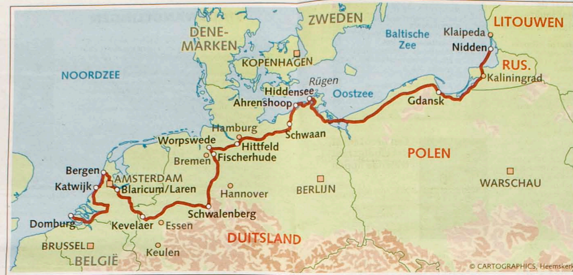
De routekaart langs de kunstenaarskolonies aan de kust. illustratie EuroART