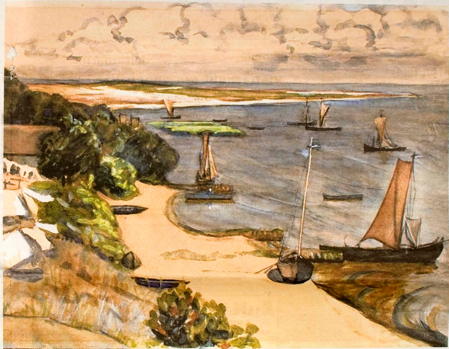
'Purwin met dem Bullwischen Haken' van Edith Wirth (Nidden)

Dankzij deze tentoonstelling zijn overeenkomsten en verschillen nu ook te aanschouwen. De resultaten van inspirerend licht en omgeving blijken legio en verre van eenduidig. „Allerlei factoren zijn van invloed”, volgens Van Vloten. Zij noemt onder meer het zoutgehalte van zee en lucht, stand van maan en zon, bebouwing, klimaat en - in de huidige tijd - de vervuiling. Daarnaast is daar als belangrijke factor natuurlijk ook altijd de kunstenaar zelf. Zo zal de bezoeker in het Domburgs Museum ervaren. Met de fraaie selectie uit de betrokken collecties wordt getoond hoe Toorop en consorten in Domburg zich tot het Nederlandse luminisme ontwikkelden, terwijl hun vakbroeders en -zusters in Nidden en Ahrenshoop hun weg zochten