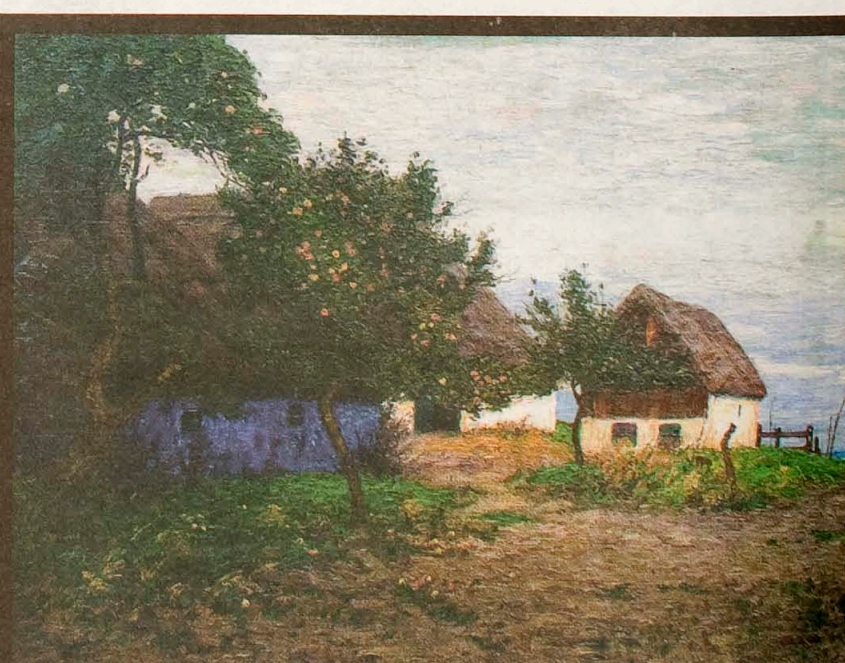
AHRENSHOOP: Paul Müller Kaempff, Gehöft am Bodden zonder jaar