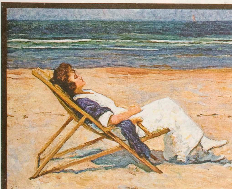
DOMBURG: Maurice Góth, Strandbeeld, 1915