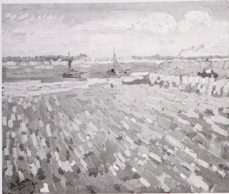
Jan Toorop, Laag water, kanaal bij Veere , 1910, olieverf op karton, 37 x 44 cm, Frans Hals Museum, Haarlem.